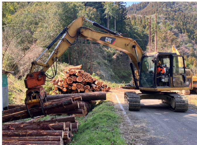
グラブを使った集材作業も