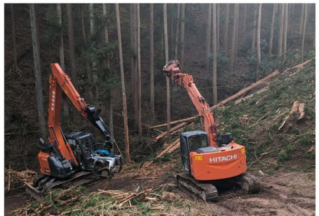
重機同士の連携もバッチリ