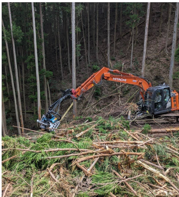
梶原運送の現場作業の様子