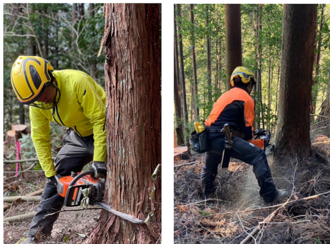
チェーンソーを使った伐木作業