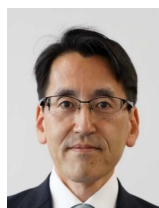
林野庁長官 青山豊久-Toyohisa Aoyama-

梶原町における、全国初の棚田オーナー制度の創設(1992年・平成4)に力を発揮していただくなど、梶原とゆかりの深い方。令和5年7月に林野庁長官に就任。