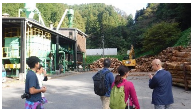
ペレット工場の視察