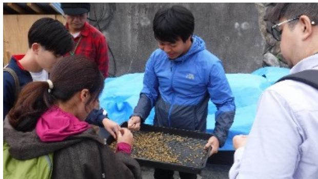
苗木園で育てているイスノキの種を紹介