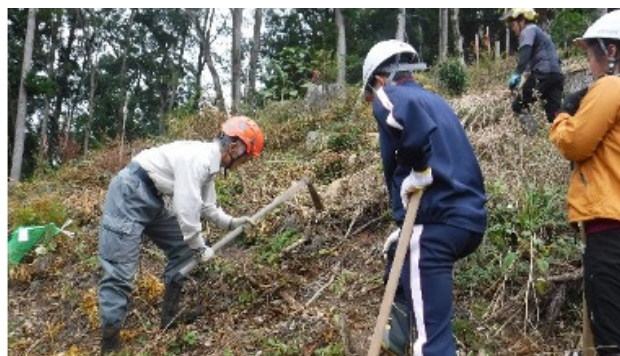
後別当で植樹体験